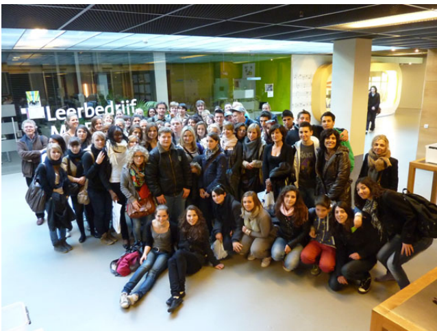
Gli studenti dei cinque paesi partner nell'atrio della Stenden University.