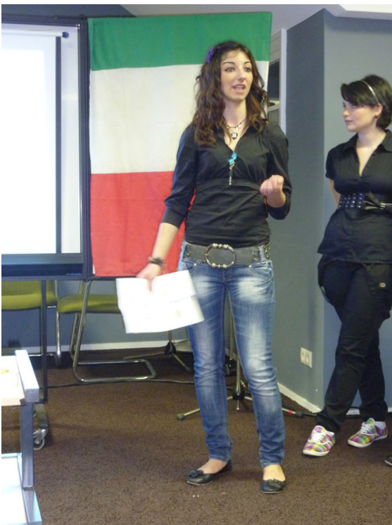
Le studentesse della classe quarta BLT durante la presentazione del sistema educativo italiano.