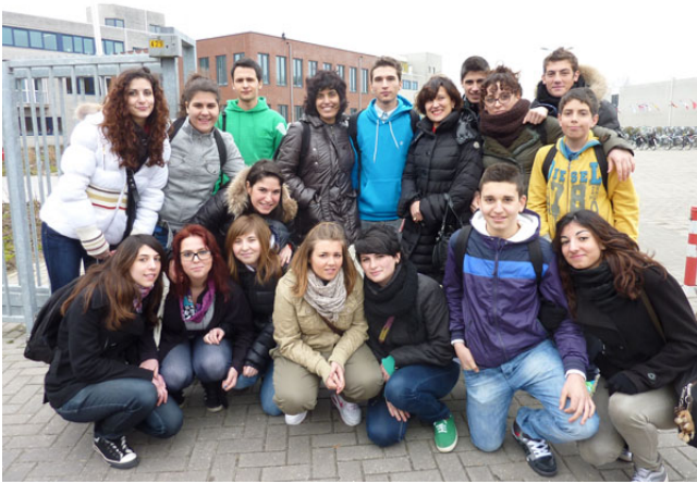
Il gruppo degli studenti italiani davanti al Montessori College di Leeuwarden, capofila del progetto.